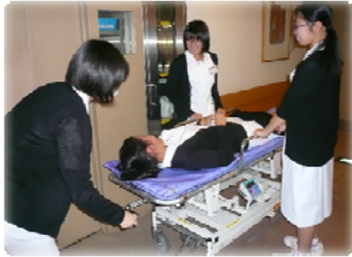
ストレッチャーの使い方を学びまし た。