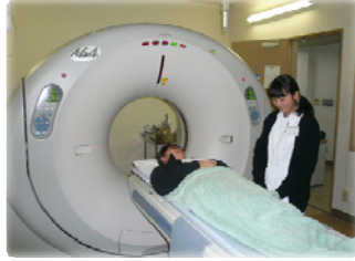
CT装置を間近で体感しました。