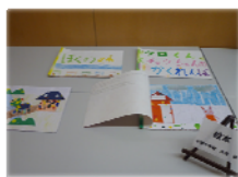
中部小学校児童 作成の絵本