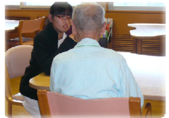
職員だけでなく、患者さんとも コミュニケーション。