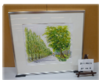
絵画 (樋口正紀さん作)