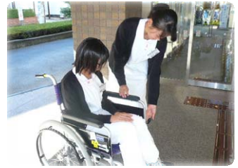
車イスでの移動の大変さを実感 しました。