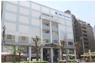
東葛クリニックみらい外観 (松戸駅西口より徒歩3分)

診療時間 午前 9:00～12:00(受付時間8:30～) 午後 13:30～17:00(受付時間13:00～)