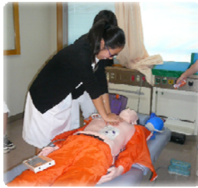
AEDを体験。心臓マッサージにも挑戦しました。