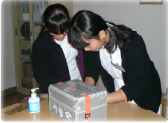
手洗いチェッカーで手洗い確認。 意外に洗い残しがあり、びっくり。

東葛クリニック病院では、近隣の小学校や中学校の依頼により職場見学を受け入れています。2014年11月には柏市立柏中学校から4名、松戸市立河原塚中学校から2名の生徒の皆さんが来院しました。院内の見学とともにいろいろな体験をしていただきましたので、その様子をご紹介します。